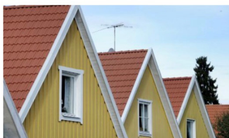
Under pandemin är det extra olyckligt med kraftiga höjningar för tomträtter. Villaägarna uppmanar Nyköpings kommun att vänta med att höja friköpspriset till 2022, skriver Lena Södersten och Tapio Helminen, Villaägarna.

Under pandemin är det extra olyckligt med kraftiga